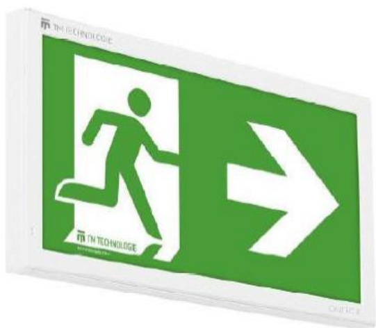
typ svítidla N2