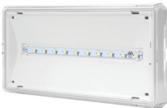
typ svítidla N1