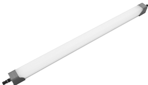
typ svítidla I2