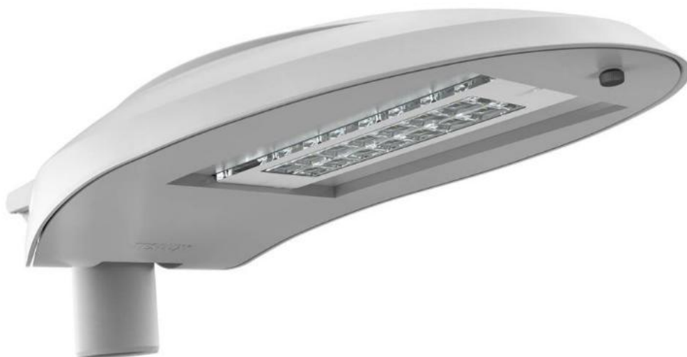
typ svítidla VO