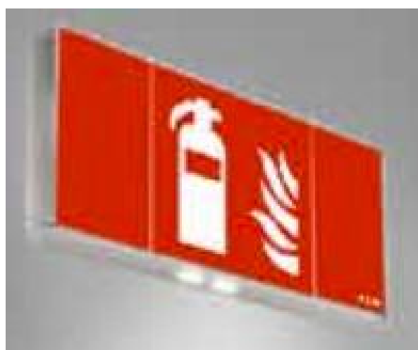
typ svítidla N3